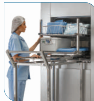
Carros de carga y transporte