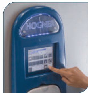
Panel de control Touch Screen

Cámara, doble pared y puertas construidas en acero inoxidable AISI 316L. Equipos de simple o doble puerta. Microprocesador con panel de operación Touch Screen e impresora alfanumérica. Permite programar y almacenar hasta 99 diferentes ciclos.