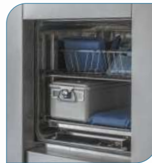
Canastos de carga, STU